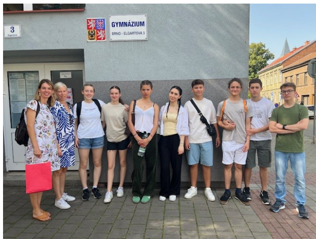
Partneri Gymnázia Elgartova z Gymnázia Ferdinanda Porsche ze Stuttgartu