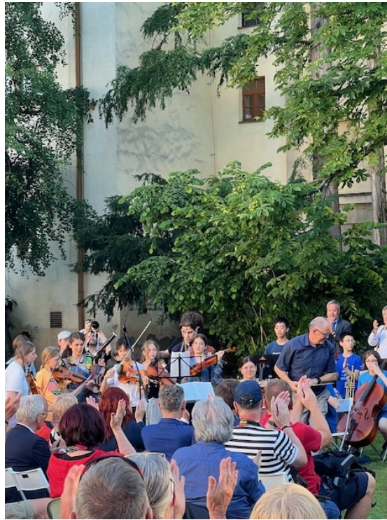
Závěr pouti smíření na Mendlově náměstí