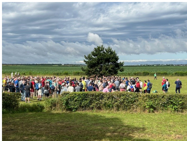
Zahájení Pouti smíření v Pohořelicích