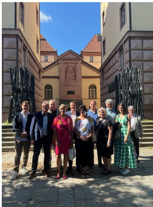
Delegace na Kounicových kolejích